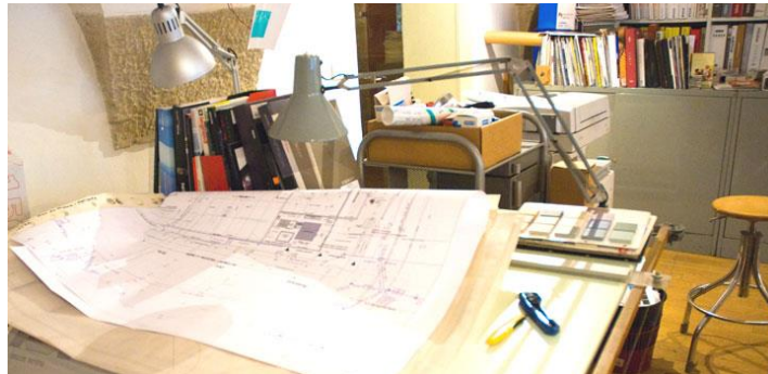
L'architecte réalise les plans détaillés de l'ensemble du bâtiment

L'architecte prépare alors les plans détaillés de tous les niveaux du ou des bâtiments, élévations, façades et éventuellement perspectives additionnelles qui assurent une bonne compréhension de l'ensemble du projet jusqu'en dans ses moindres détails. Selon les besoins spécifiques de chaque projet, des bureaux d'études techniques sélectionnés par le maître d'ouvrage sur conseil de l'architecte conduisent en parallèle la mise au point de leur plan d'action, en collaboration étroite avec l'architecte en vue d'une intégration réussie de leur expertise dans l'ensemble du projet.