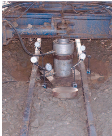
▲ Détail d'un essai de chargement

Pour satisfaire à ces contraintes, il a été conçu et exécuté environ 12.000 ml de colonnes ballastées d'environ 12 m de profondeur sous l'ensemble du radier. Le dimensionnement permettait de porter la contrainte du sol ainsi traité à 2 bars.