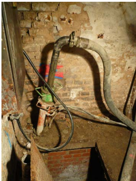
▲ Injection du mortier