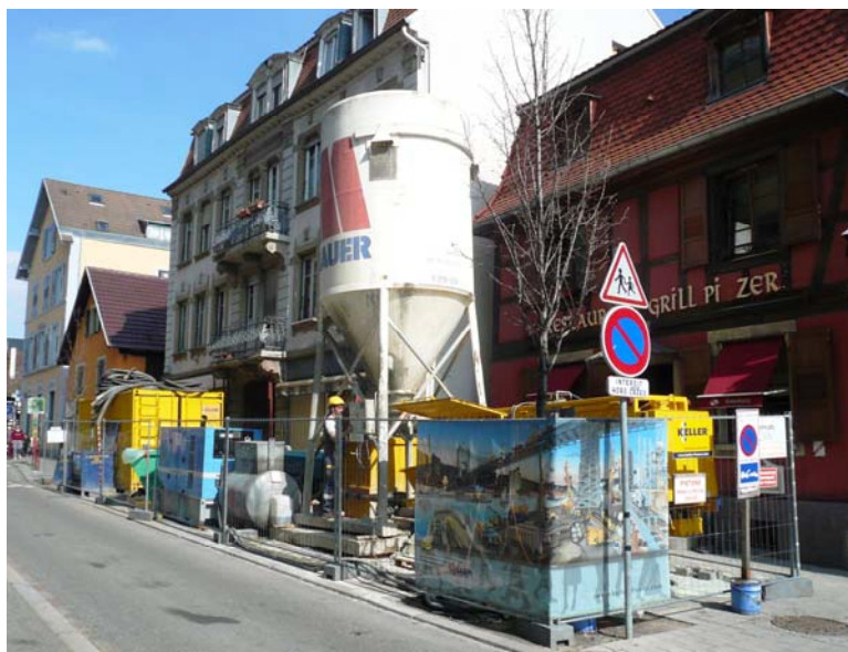
▲ Installation de chantier