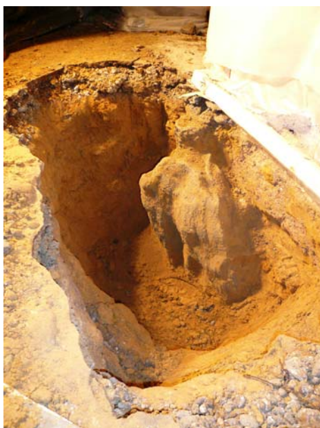
▲ Dégarnissage partiel d'une colonne de CHS