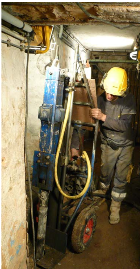
▲ Mise en place du matériel de fonçage